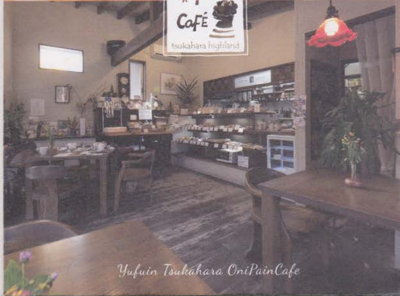
Yufuin Tsukahara OniPainCafe