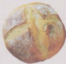
↑カンパーニュ・プレーン

体に良いパン、生地そのものを味わうパン。フランス粉、ライ麦、全粒粉に塩のみで作られています。